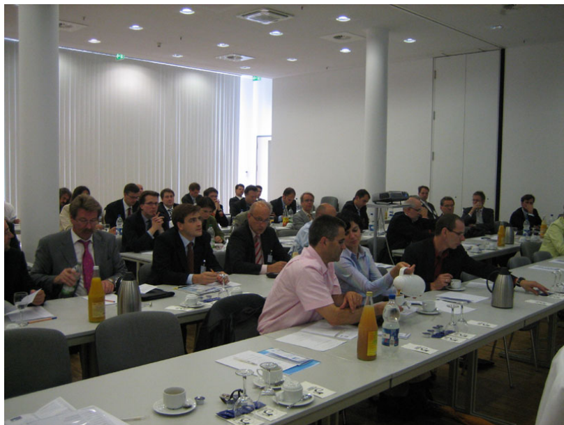
Die Teilnehmer des Workshops „Einführung der Telematik-Infrastruktur – Bremseffekt oder Förderung bei der Etablierung neuer Versorgungsformen“ in Berlin.

Nach dieser gelungenen Auftaktveranstaltung in den Räumlichkeiten der BMC-Geschäftsstelle in Berlin, dürfen wir uns alle auf weitere Workshops mit dem Kooperationspartner BMC e.V. freuen. Der nächste wird bereits am 10. Oktober das Thema „Der Patient im vernetzten Heim“ aufgreifen.